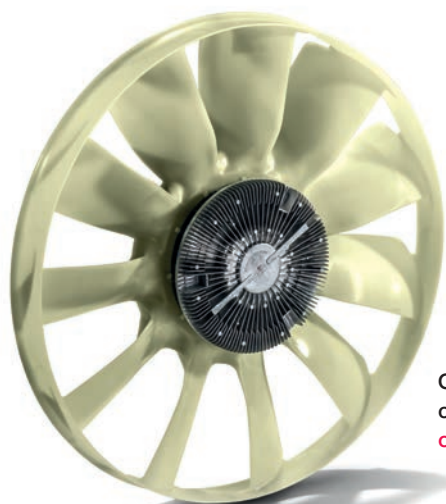
Оригинальная вязкомуфта MAN с крыльчаткой вентилятора от 43 990 руб.