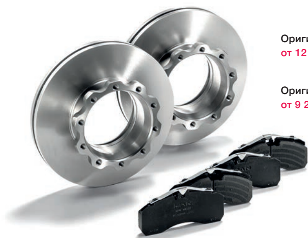
Оригинальные тормозные диски MAN от 12 160 руб.