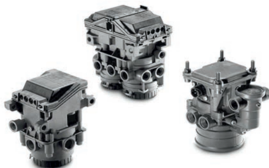
Оригинальные тормозные клапаны MAN от 9 380 руб.