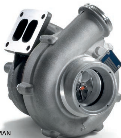
Оригинальные турбокомпрессоры MAN от 66 960 руб.