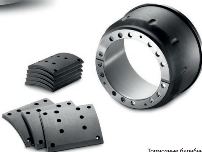
Тормозные барабаны MAN от 13 311,60 руб. с НДС