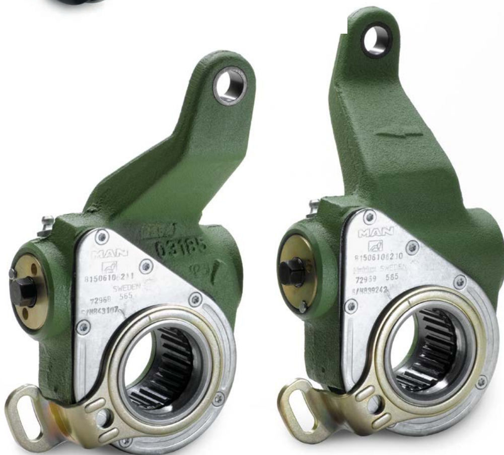
Компенсаторы износа MAN от 7 864,80 руб. с НДС