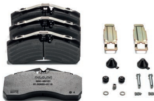
Тормозные колодки дисковых тормозов MAN от 7 864,80 руб. с НДС