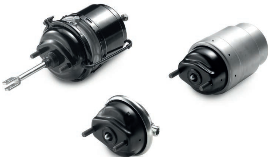
Тормозные цилиндры MAN от 9 666,00 руб. с НДС