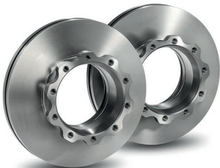
Тормозные диски MAN от 12 903,60 руб. с НДС